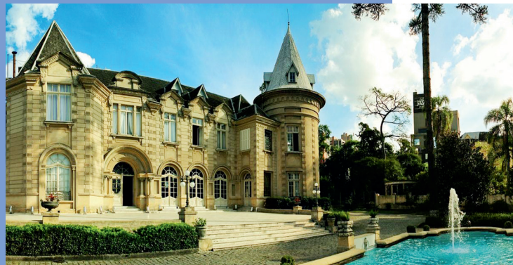
ÁREA EXTERNA DO CASTELO DO BATEL, EM CURITIBA