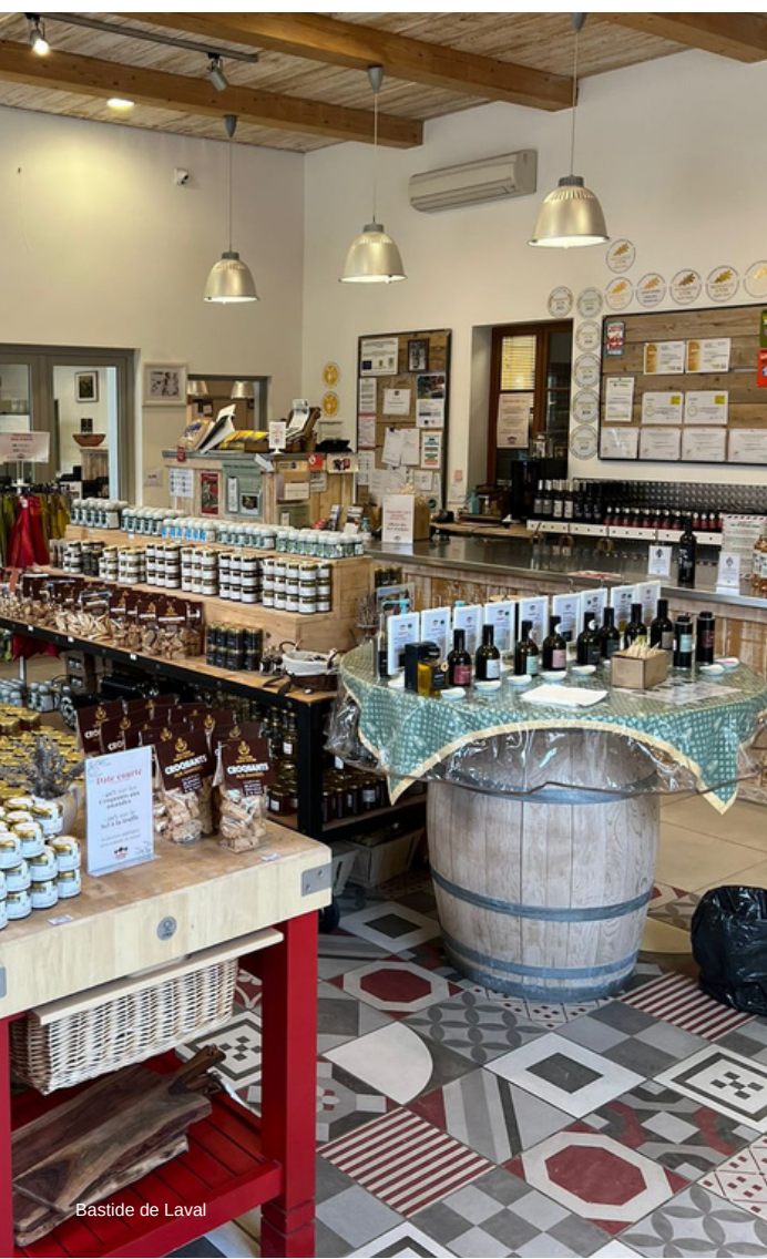
Bastide de Laval

Restaurante Auberge la Fenière (estrelado Michelin)