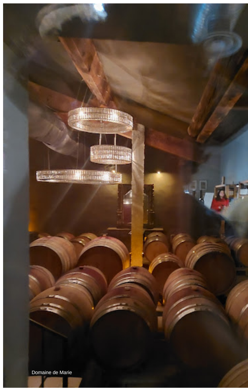
Domaine de Marie