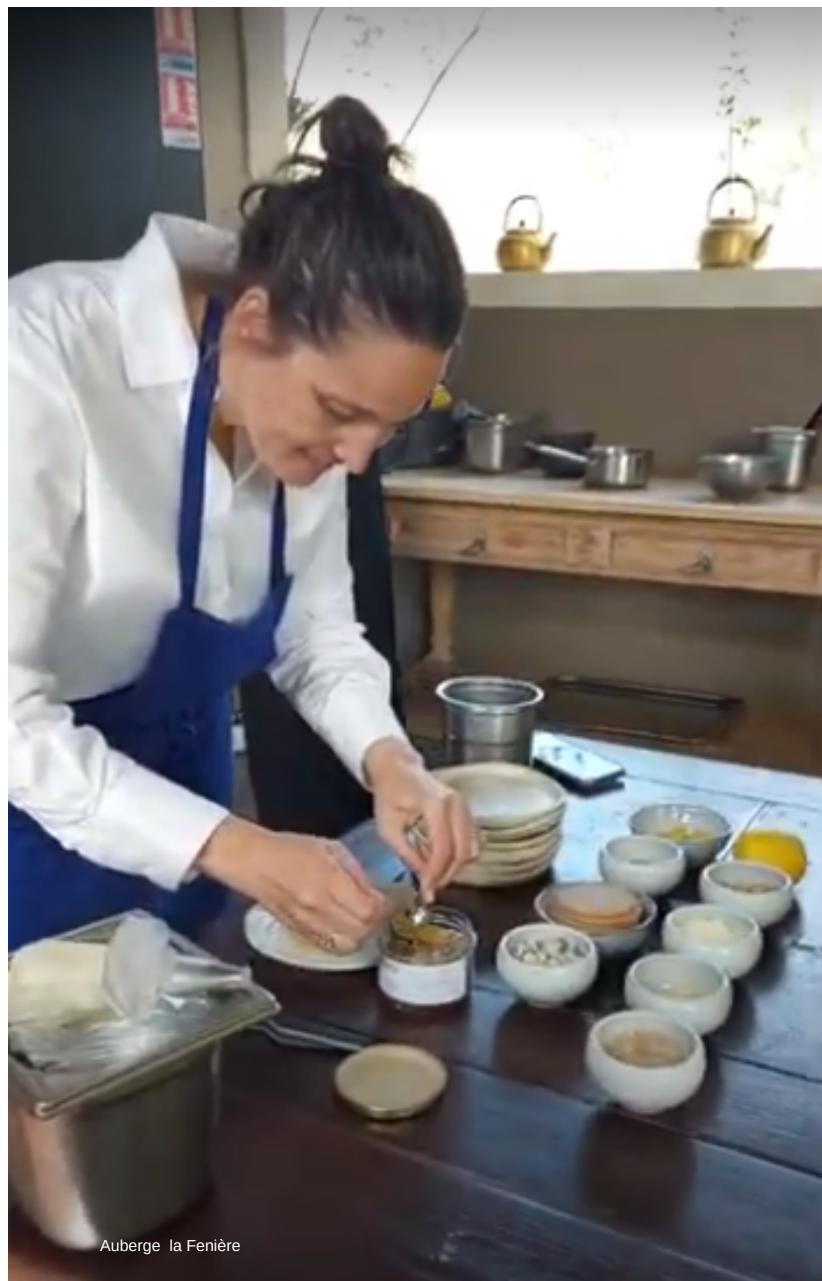
Auberge la Fenière