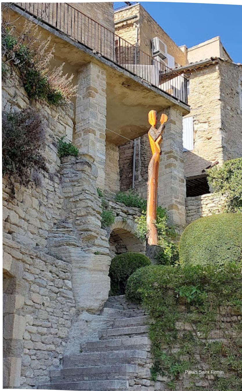
Palais Saint Firmin

Cidade de arte e história marcada em suas ruas estreitas, ateliês, mas também por seu subterrâneo.