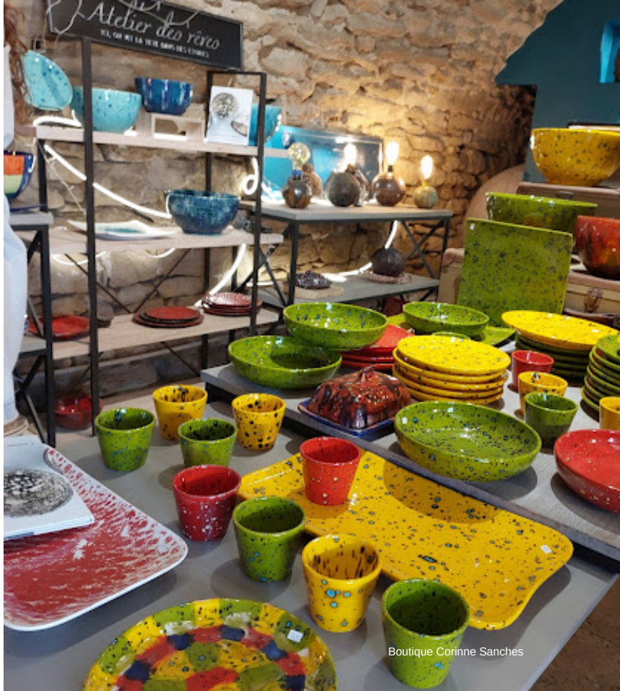
Boutique Corinne Sanches

Sessão de compras nas boutiques de artesãos locais, perca-se nas ruelas da cidade.