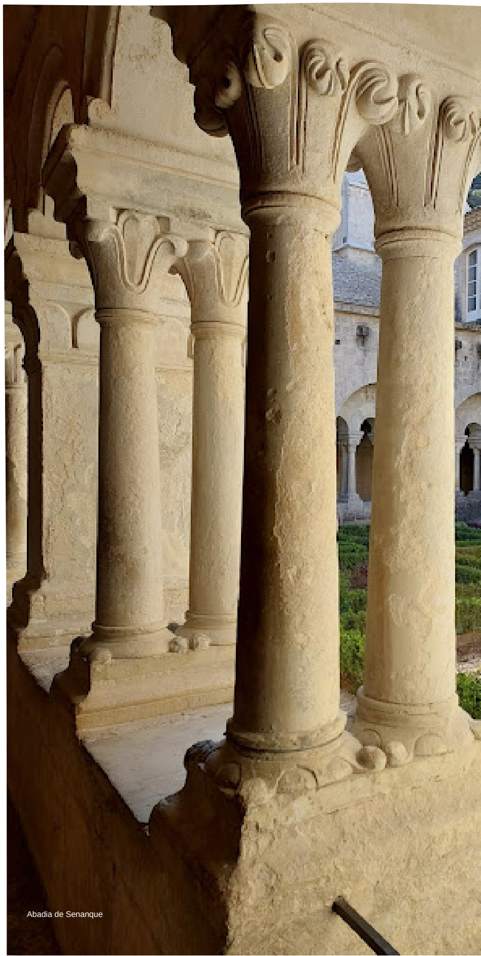
Abadia de Senanque