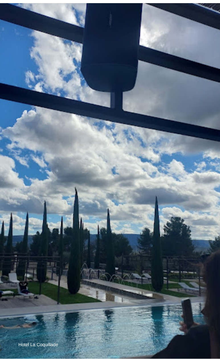
Hotel La Coquillade

No retorno para Gordes, uma parada em Oppède (3,5 km) para um café em um dos terraços do vilarejo.