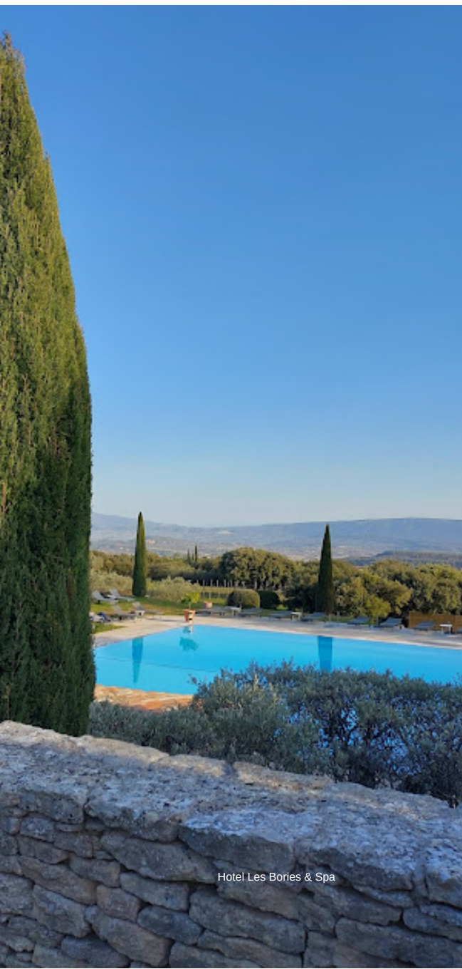
Hotel Les Bories & Spa

Visita às cavernas do Palais Saint Firmin, no subterrâneo de Gordes.